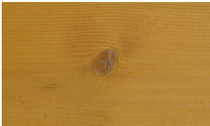
Abb. 2.1: Abwitterungsstufe 1