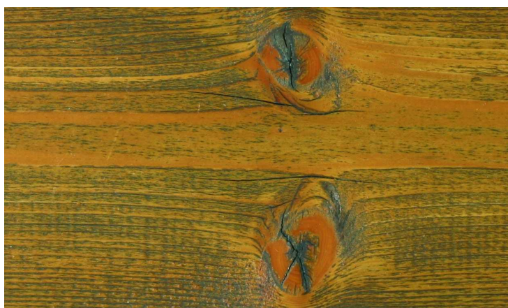
Abb. 2.3: Abwitterungsstufe 3

**) Holzschutzmittel vorsichtig verwenden. Vor Gebrauch stets Etikett und die jeweiligen technischen Merkblätter der Produkte beachten.